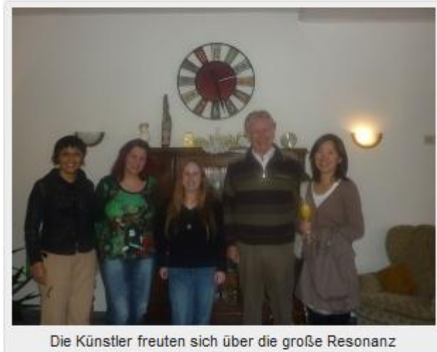
Die Künstler freuten sich über die große Resonanz